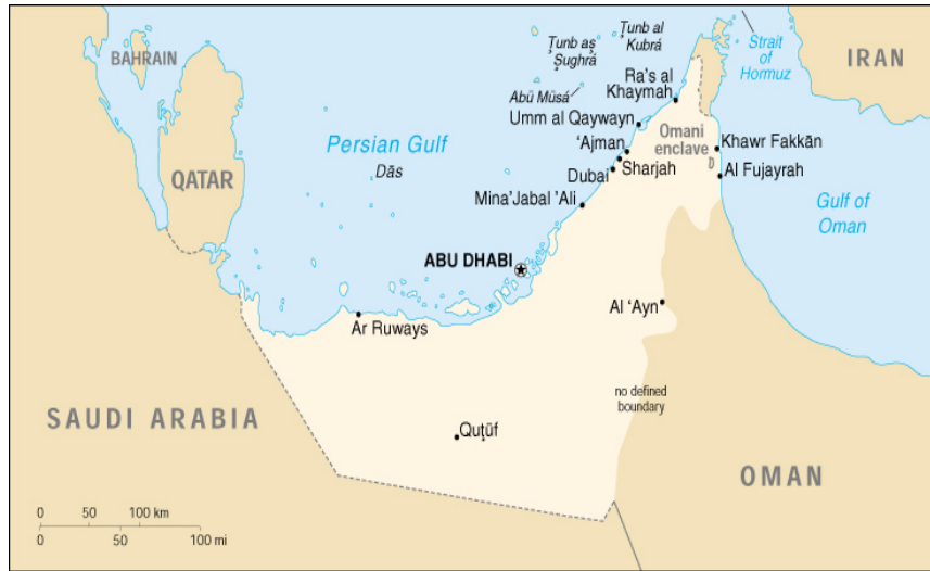
MIDDLE EAST AREA2 الإمارات العربية المتحدة