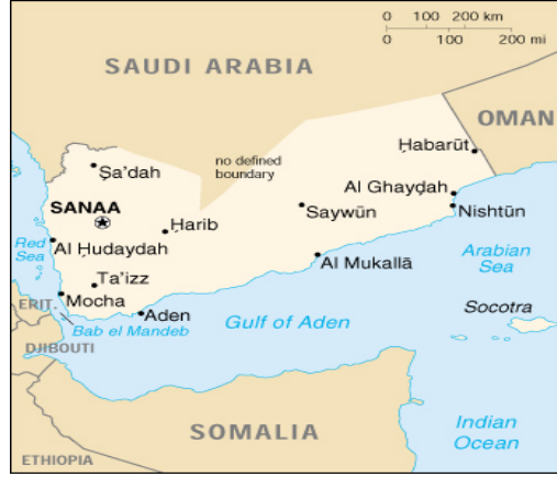
MIDDLE EAST AREA2 اليمن