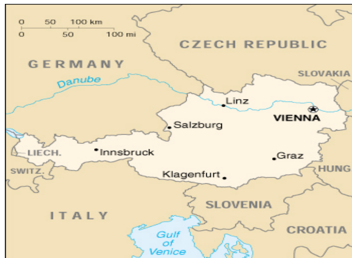
ألمانيا AREA2 EUROPE